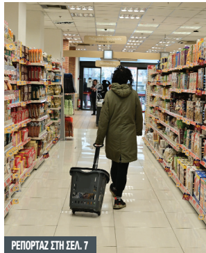
ΡΕΠΟΡΤΑΖ ΣΤΗ ΣΕΛ. 7