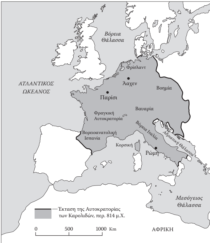
Η Αυτοκρατορία των Καρολιδών υπό τον Καρλομάγνο, περ. 814 μ.Χ.

σεων κατάκτησε μεγάλο μέρος της δυτικής Γερμανίας από αυτούς και επιπλέον τους υποχρέωσε να προσπλυτιστούν στον χριστιανισμό. Ο ακούρατος Καρλομάγνος προσάρτησε επίσης τη βόρεια Ιταλία, τη βορειοανατολική Ισπανία, τη Βαυαρία, τη Φριζία και τμήματα της Αυστρίας και της Βοημίας. Την ημέρα των Χριστουγέννων του 800, ο πάπας τον έστεψε πρώτο Άγιο Αυτοκράτορα των Ρωμαίων. Ο τίτλος υποδείκνυε ότι ήταν διάδοχος